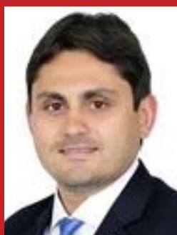
JUSCELINO FILHO (DEM)